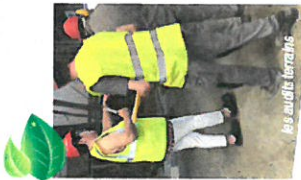
La qualité humaine

Une équipe d'auditeurs internes formés assurent toute l'année les contrôles opérationnels.